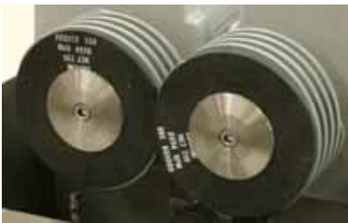
Pietre di molatura