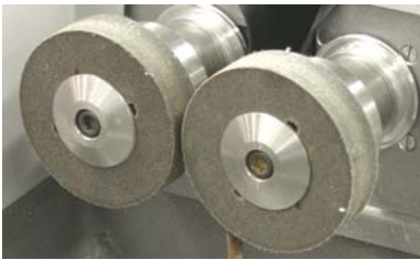
Ruote della tamponatrice

PRIME Edge® COZZINI CUTTING EDGES AND SHARPENING SOLUTIONS