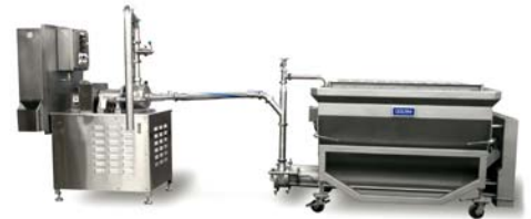
Система AR922 со шнековым загрузчиком