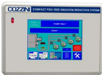
Pantalla sensible al tacto

PrimeCut™ COZZINI EMULSION/REDUCTION SYSTEMS