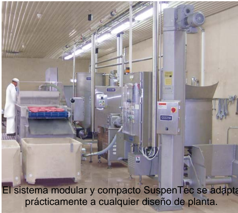
El sistema modular y compacto SuspenTec se adapta prácticamente a cualquier diseño de planta.

Desde la(s) tolva(s) de retención, una bomba envía la suspensión a un inyector estándar. El producto de puro músculo es inyectado con la suspensión hasta alcanzar el rendimiento predeterminado. El exceso de suspensión del inyector es capturado por una tolva de retorno y reprocesado.